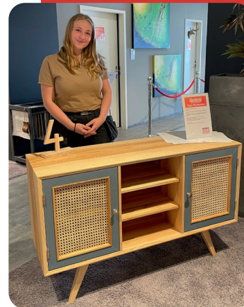
Kreativ und handwerklich on top: Gesellenstücke werden bei der Hesebeck Home Company ausgestellt.

Beteiligung an Investitionen und Umbaumaßnahmen in den Gilden zur Förderung der Jugendarbeit